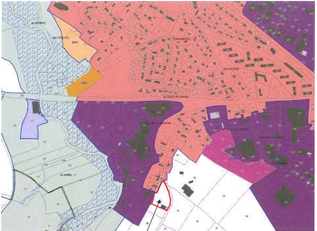
Planche n° 042 ST HILAIRE DU HARGOUEZ Format A3 au 1 / 5 000 ème

Parcelle ZH 66 p, « l'aumondais » à ajouter au zonage U