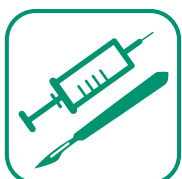
DÉCHETS D'ACTIVITÉS DE SOINS À RISQUES