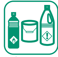
DÉCHETS DIFFUS SPECIFIQUES (DDS)