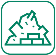
DÉBLAIS / GRAVATS