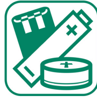
PILES ET ACCUMULATEURS