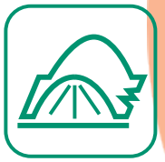
FILMS AGRICOLES USAGÉS

→ Chambre d'agriculture Adivalor Lieux de vente