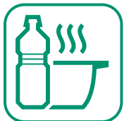
HUILES DE FRITURES