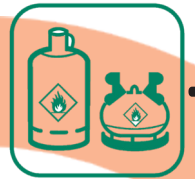
BOUTEILLES DE GAZ