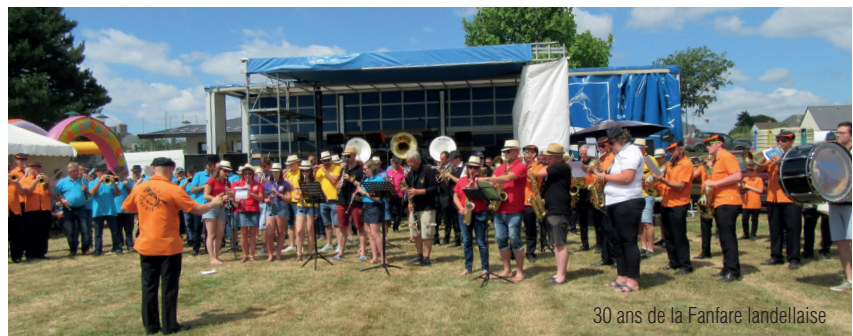
30 ans de la Fanfare landellaise