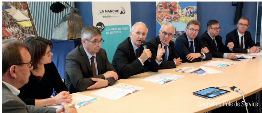
Contrat de Pôle de Service