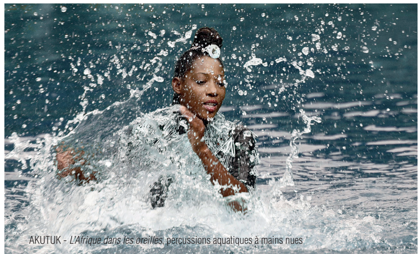
AKUTUK - L'Afrique dans les oreilles , percussions aquatiques à mains nues