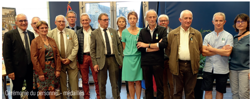
Cérémonie du personnel - médailles