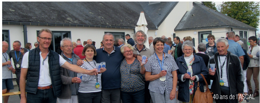
40 ans de l'ASCAL