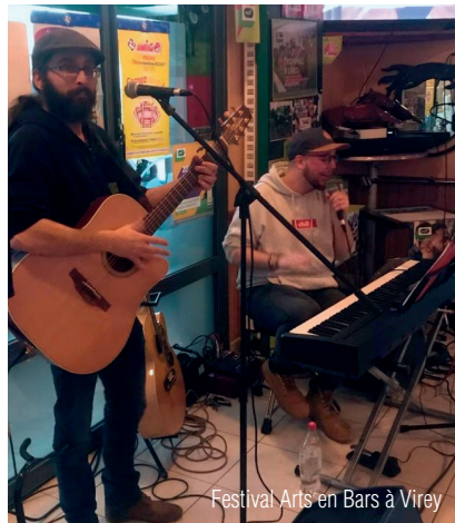
Festival Arts en Bars à Virey