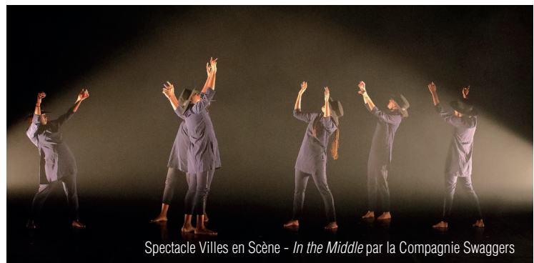
Spectacle Villes en Scène - In the Middle par la Compagnie Swaggers