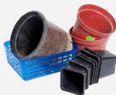
Pots et barquettes de jardinage