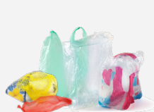
Sacs et suremballages