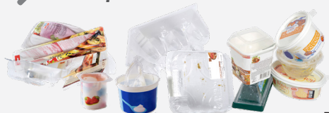
Boîtes, pots et barquettes