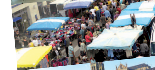
Marché le mercredi