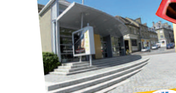
Cinéma numérique 3D